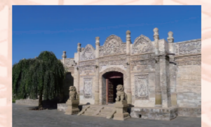
6. 伊金霍洛旗郡王府