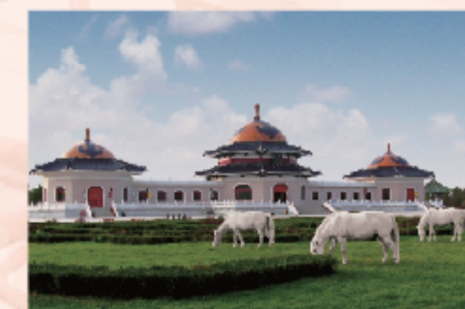
1. 成吉思汗陵旅游区