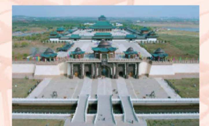
4. 鄂尔多斯文化产业园